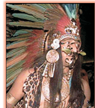
La sabiduría tradicional preserva el medio ambiente.

Más de 2.500 lenguas están en serio peligro de extinción y muchas más, de acuerdo a los expertos de la ONU, están perdiendo el contacto con la naturaleza que les rodea. Más de 200 lenguas indígenas ya han desaparecido.