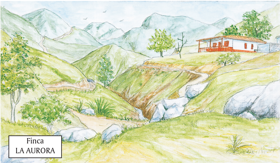
Finca LA AURORA