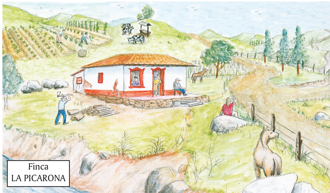
Finca LA PICARONA