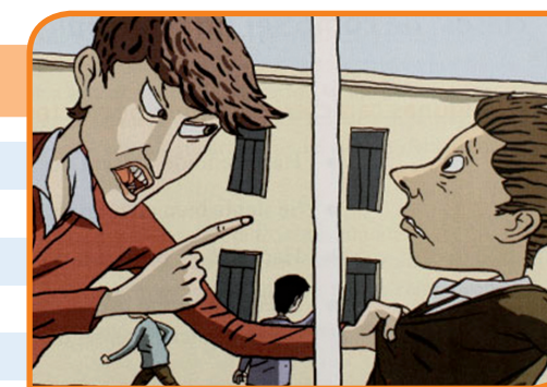
Figura 2: Matoneo escolar.