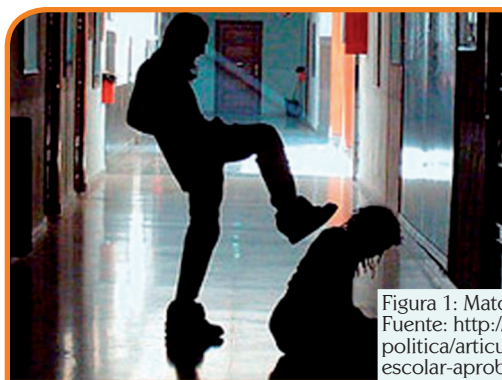
Figura 1: Matoneo en los colegios.

En último debate fue aprobado por el Senado de la República el proyecto de ley que ataca de frente el matoneo. En los colegios del país.