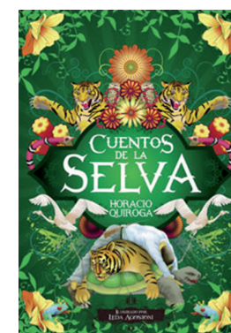
Figura 2: Cuentos de la selva.

Terminamos la Unidad 3 con éxito. Para fortalecer nuestros aprendizajes leemos alguno de los libros sugeridos que nos invitan a explorar nuevos caminos por la literatura y la creatividad