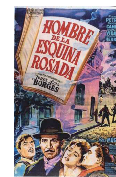
Figura 4: El hombre de la esquina rosada.