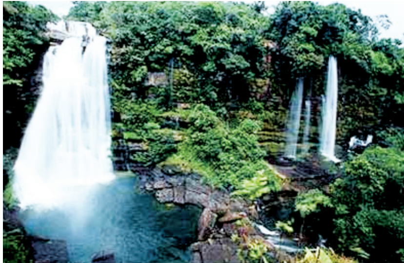
Cascada de Caño en la Sierra de la Macarena, Colombia.

Esta es una contradicción difícil de entender, pero que es real. Y como es nuestra costumbre, hacemos responsable al Estado de su solución y no evaluamos nuestro grado de responsabilidad en el problema y la manera como podemos contribuir a solucionarlo.