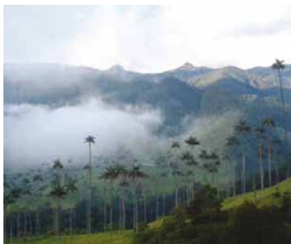
Valle del Cocorá.