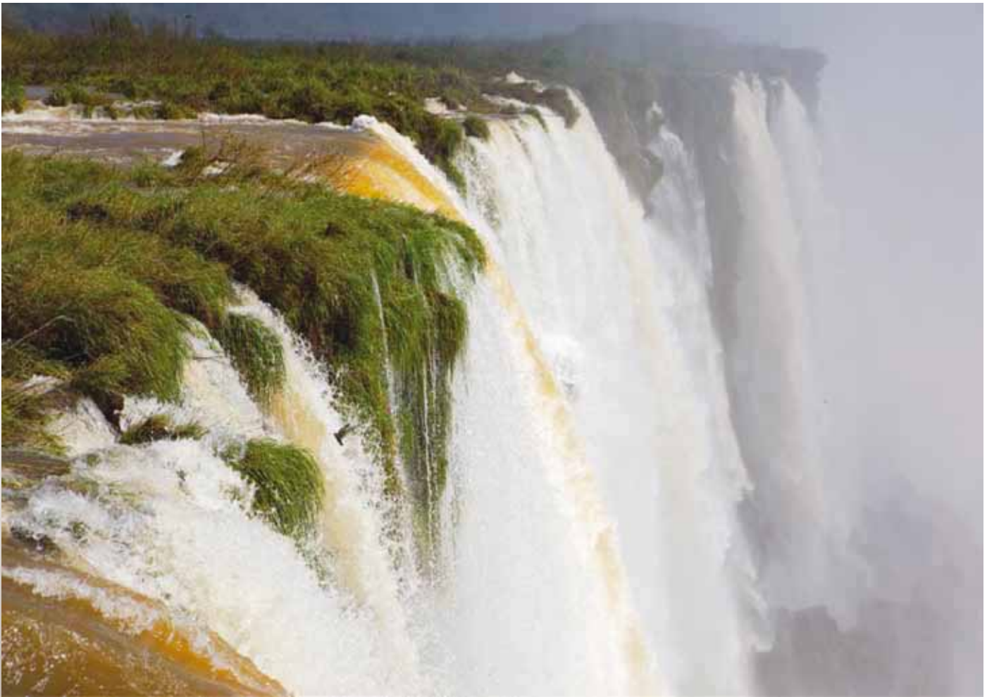
Cataratas de Iguazú, Brasil - Argentina.