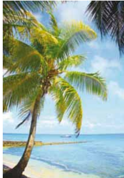
San Andrés, Colombia.